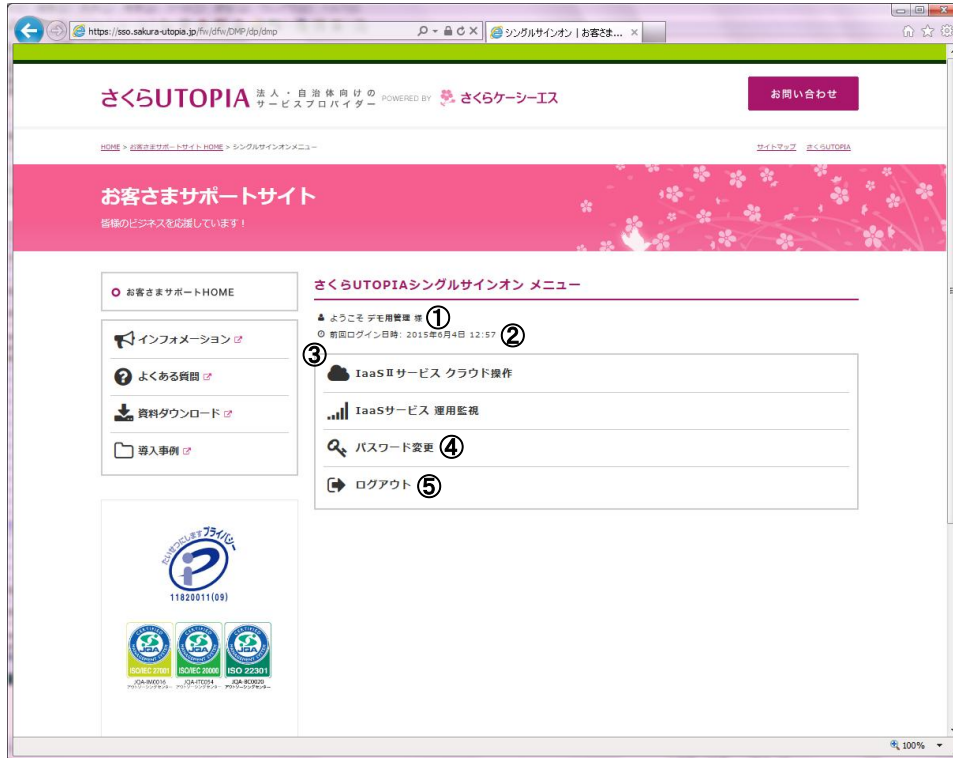
図 4.1.1 メニューページ