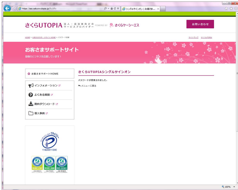
図 5.1.3 パスワード変更完了

パスワード変更に失敗した場合、以下のようなエラーが表示されます。 [OK]をクリックし、再度変更をやり直してください。