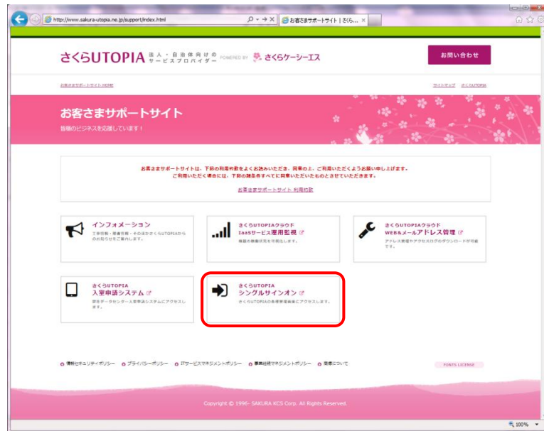
図 3.1.1 お客さまサポートサイト

または、“お客さま設定情報”に記載の「シングルサインオン認証ページ」の URL へアクセスします。