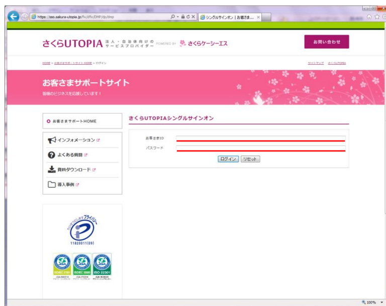
図 3.2.1 ログインページ

“お客さま設定情報”に記載のお客さま ID とパスワードをそれぞれ、 お客さま ID 、 パスワード に入力し、[ログイン]ボタンをクリックします。