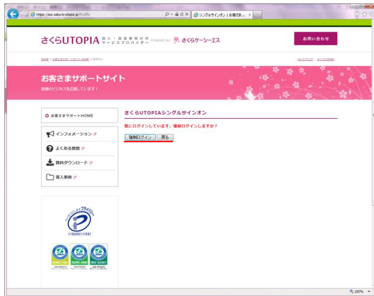
図 3.2.4 既ログイン中

以下のページが表示された場合は、別の利用者がご利用ユーザー一名で既にログインされています。