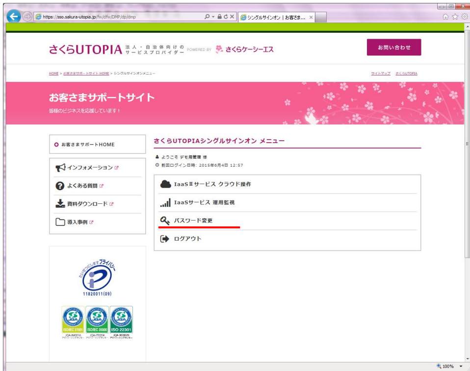
図 5.1.1 パスワード変更

メニュー画面（ログイン後に表示される画面）より [パスワード変更] リンクをクリックします。