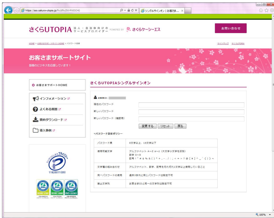
図 5.1.2 パスワード変更ページ