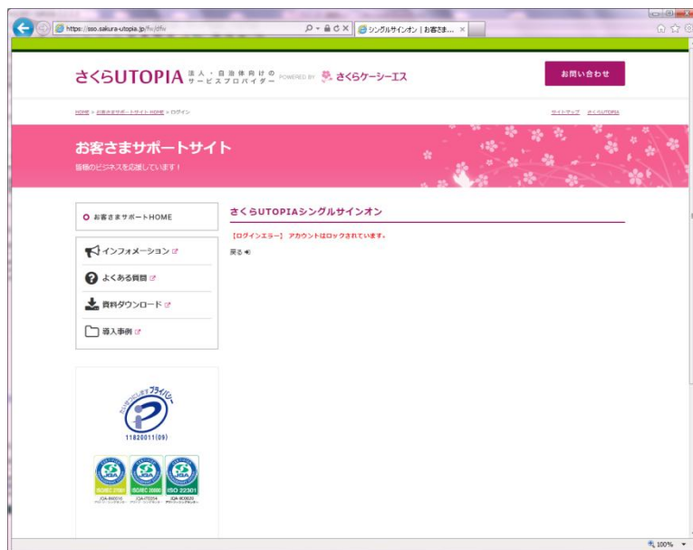
図 3.2.3 連続 5 回ログイン失敗ページ

また、連続して 5 回ログインに失敗した場合、以下のページが表示されます。この場合は一定時間（約 15 分）ログインをお待ちいただきますようお願いいたします。